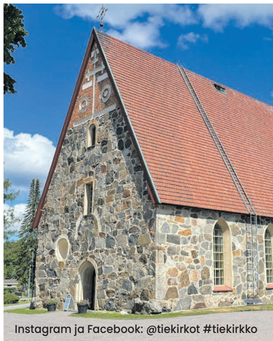
Instagram ja Facebook: @tiekirkot #tiekirkko

Kirkkoihin voi poiketa myös hiljentymään ja pitämään taukoa rauhasta, kauneudesta ja pyhästä nauttien.