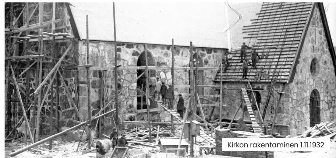
Kirkon rakentaminen 1.11.1932