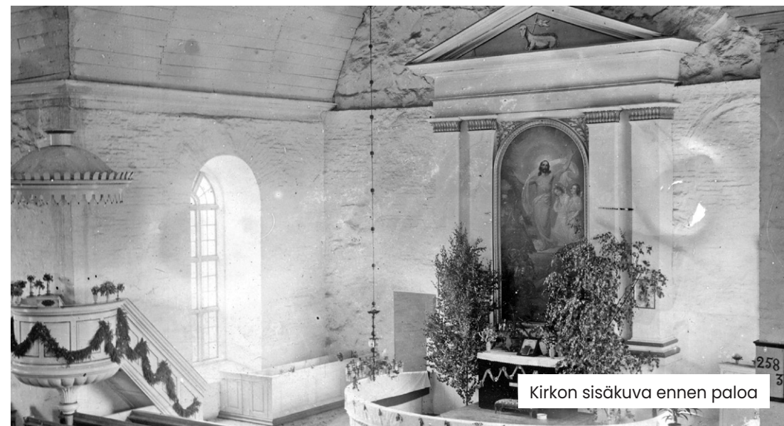
Kirkon sisäkuva ennen paloa